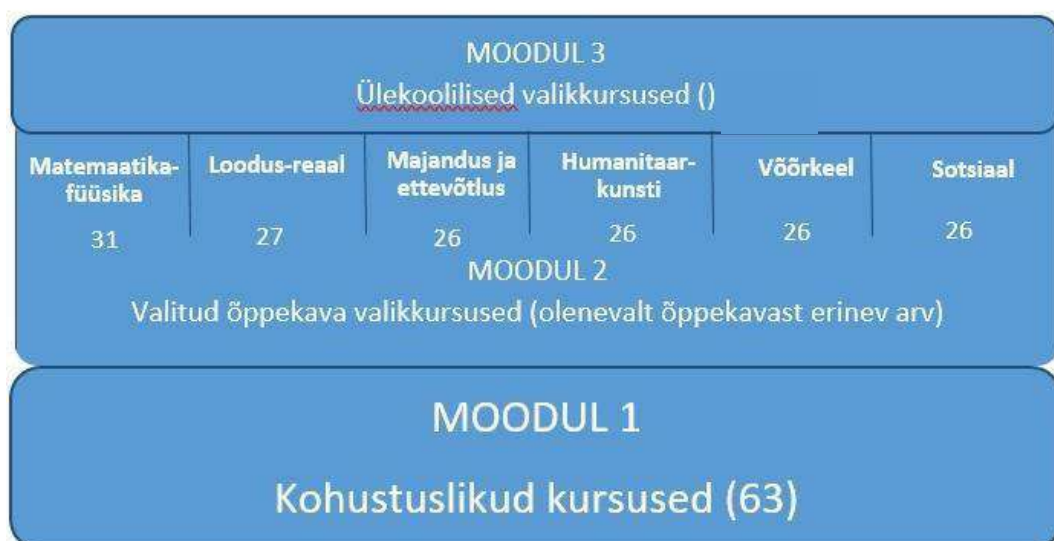
Skeem 1. Õppekava moodulid

Alloleval skeemil (vt skeem 1) on toodud moodulite põhine õppekava jaotus. Moodul 2 juures on toodud vastava õppesuuna õppekava valikkursuste arv.